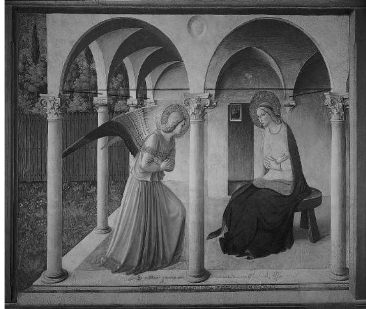
The Annunciation of The Lord