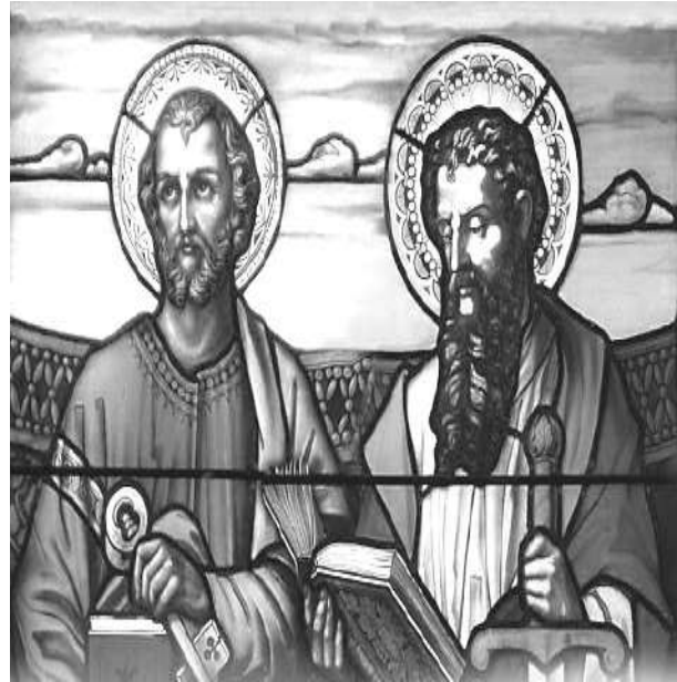
Sts. Peter and Paul