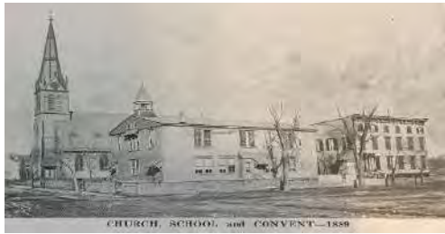
CHURCH, SCHOOL, and CONVENT—1880